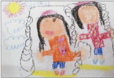
5 「幼稚園のお友達とブランコ」