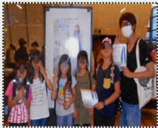
めっちゃ綺麗な声やった

6月1日、株式会社つばさプラズ様から招待頂き、岸和田市浪切ホールにて開催された“川嶋あいLIVE TOUR 2019 雨足 大阪公演”に職員児童合わせて8名で行かせて頂きました。二階席の前列目の座席で、「目の前やん！」と喜んでいま