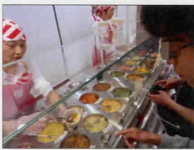
どの具材にしようかな

カップヌードルミュージアムでは世界に1つのオリジナルカップラーメンが作れるという事で現地に着くと早速ラーメン作り。まずは300円でカップを購入し、マジックでイラストを描きます。みんな「何を描こうかな。どんなイラストがいいかな。」と悩みながら、アニメのイラストを描いたり、キャラクターを描いたりしました。カップのイラストを描き終わると次は具材選びです。まずは4種類のベースになる味を選び、その後12種類ある具材から4つを選びます。みんな「どの組み合わせが美味しかな。」と考えながらそれぞれ具材を決めました。最後にカップに蓋をし、完成です。出来上がったカップ