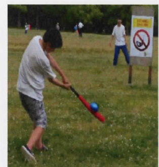
ナイスバッティング！

「鬼ごっこする人この指とまれ！早くしないと切れちゃうぞ」と友人に呼び掛けたり、「先生キャッ