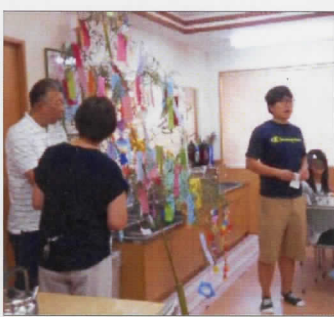
願いを込めようといいいね

6月に募集した絵画コンクールの表彰式を行いました。小学校低学年、中学年、高学年、中学生、高校生と各部門に分かれ、金賞、銀賞、銅賞、職員激励賞を発表しました。名前を呼ばれた児童は驚いて目をまん丸くさせた後「やっ！嬉しい。」ととても喜んでました。