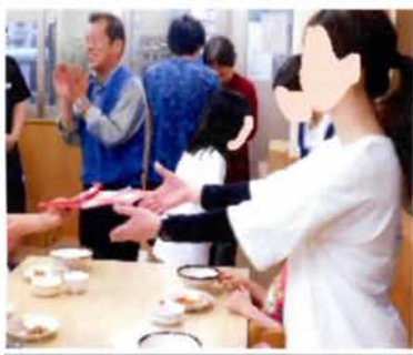
いつもありがとう

5月11日には女性職員に、6月21日には男性職員に感謝する集いが行われました。毎年の母の日と父の日に合わせて行われるこの行事は、児童会の主催で職員へプレゼントと手紙が用意されました。児童会会長より「普段は恥ずかしくてなかなか言えませんが…」と手紙が読み上げられると食堂は温