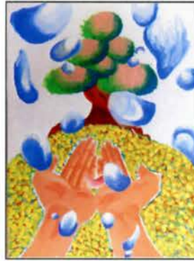
高校生の部 金賞 驟雨(しゅうう)