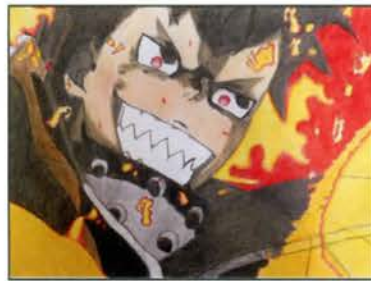
高校生の部 銀賞 炎炎の消防隊