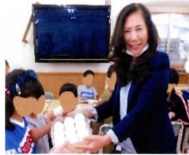
笑顔もお菓子もいっぱい