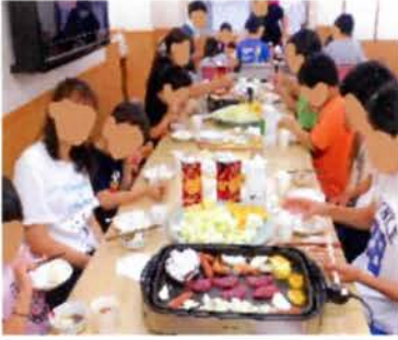
お肉でお腹いっぱい

それでも児童は「はくも焼く」「私はウインナー係する」と天はしゃぎで楽しみながら食べていました。中には指導員に「僕が一生懸命焼きました。」と焼いたエビを差し出す児童も…。肉だけでなく、玉ねぎや