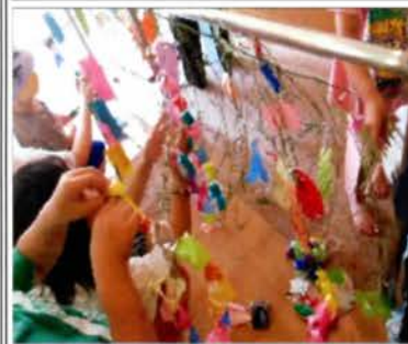
願いが届くように

あいにくの曇り空での七夕でしたが、みんなの笑顔がキラキラ輝く七夕の集いとなりました。