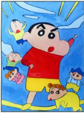
高校生の部 銅賞 クレヨンしんちゃん