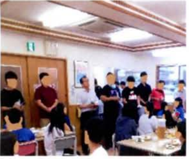
これからもよろしく

そして、女性職員にはボーチが男性職員にはコップが手渡されました。それには手作りのメッセージカードが添えられており、読んだ職員から思わず笑みがこぼれていました。児童からの「いつもありがとう」との一言には「児童の為に」と原動力になる不思議な力が込められていました。「感謝には感謝を」とこれからも頑張ってくださいと職員一同で決意を新たにしました。