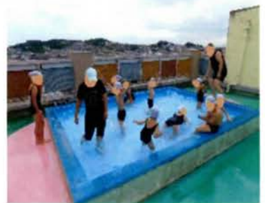
冷たくて気持ちいい