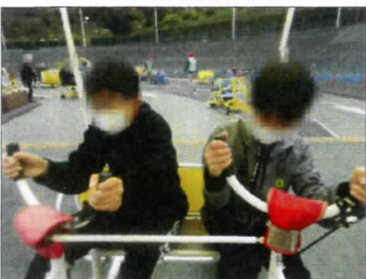
隣に座るこの二人乗りは、道路交通法違反になりますか？

自然破壊、地球温暖化をテーマに描きました。蚕食鯨呑の言葉の意味は大国が小国を侵略する意味です。その鯨が人間の自然破壊によって傷つけられている絵です。青い海は廃油で黄色く染まり、鯨の体は機械に蝕まれ、目に涙が。昔の綺麗な大海原をもう一度夢に見るメッセージを込めました。金賞を狙っていたので残念ですが、次回も頑張ります。 H・H