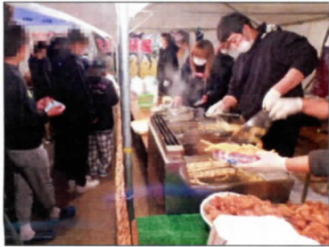
目の前で調理されて、熱々の食事が提供されました

12月19日、B級グルメの会様にたくさんのお出掛けをして頂きました。肉吸い、ロンクポテト、からあげ、チーズボール、フランクフルト、牛串、焼きそば、わたがし、ミルクせんべい、ジュースと様々な食べ物所狭しと並びました。当然物でも玩具や駄菓子がたくさん並び、更にベビーカーステラのお土産まで用意して頂きました。児