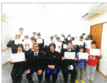
誇らしげな表情の児童たち。褒められると自信になりますね。

表彰された児童、惜しくも表彰されなかった児童と様々ですが、また来年に向けてよりいっそう成長してほしいと思いました。