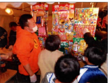
当てものの種類もたくさんで目移りしてしまいます

童は「わたあめ甘くて美味しい」「ポテトのキャラメル味やばい」「焼きそば最高」と児童は美味しい食べ物に舌鼓を打ちました。美味しいのひと時でした。