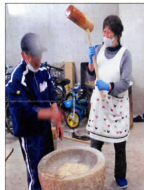
園長と副園長の 息の合った餅つき

昨年に続いて今年も職員のみで餅つきをしました。力いっぱいついた後に丸められた餅はきな粉餅にして児童に振舞われました。児童は口いっぱい頬張って「おいしい」「もっちりもちゅー」「きな粉もうまいな」と喜んでいました。