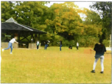
夢中で遊びました。 袖をまくってもまだ暑い