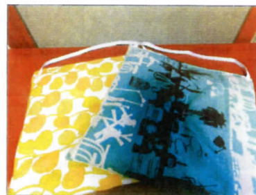
完成した食堂の椅子用座布団 たくさん製作して頂きました