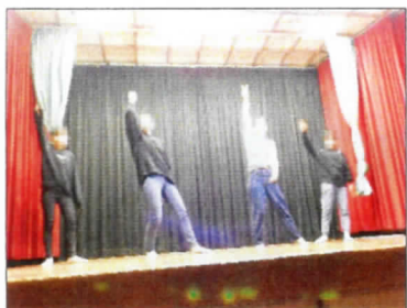
客席から声援が飛び交うダンスダンサーも熱が入ります

文化の日の夜は、会食と善行児童表彰に続き、多目的ホールにて演芸会を行いました。児童がグループを組み、出し物を披露する楽しい催しです。最初の幼児のダンスが始まるとその愛らしい姿に皆メロメロです。小学生男子はアニメのキャラクターになり切り、女子グループは人気アイドルになり切つてダンスを披露し、「かわいい」の声だけでなく、「かっこいい」と声援が飛び交いました。また、事前に撮影したドッキリ映像の出