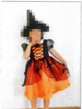
魔法使いに扮して 「ハイポーズ」パシャ

10月31日、幼児はカチューシャを付けたり、ウルトラマンやアンパンマン、プリキュアなどの仮装をしてハロウィンを楽しみました。児童はおやつ時間に、職員からハロウィンの行事について詳しく教えてもらい、「トリックオアトリート!お菓子くれなきやいたずらしちゃうぞ」と職員に言い寄ってハロウィン用お菓子を受け取りおやつ時間を楽しみました。