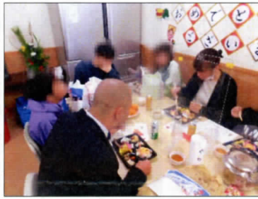
お節料理とお雑煮と 食べ過ぎてしまいそうです

参拝をすませた後におみくじを引いて結果に一喜一憂したり、出店のくじびきで賞品が当たって喜んだり、「これ美味しい」とたこ焼きやベビーカステラを口いっぱい頬張ったりとそれぞれが楽しく正月を過ごしました。