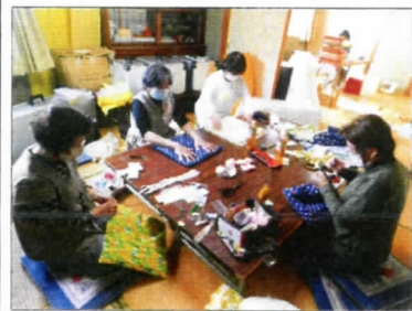
テキパキと作業を進める 更生保護女性会の皆さん

10月20日、柏原市更生保護女性会の方6名が来て下さり、人気アニメキャラクターの柄や花柄の手提げかばんや枕カバー、食堂のふかふかの座布団をたくさん作って頂きました。