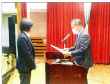
嬉しいけど緊張する表彰式 だって突然名前呼ばれるもんね

意され、皆が前を向いて顔をあげて静かに園長からの激励の言葉に耳を傾けていました。