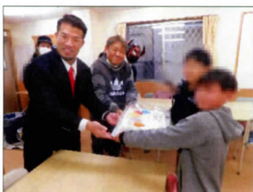
クリスマスに合わせてケーキを届けていただきました

ケーキを食べながら指導員の司会でビンゴ大会が始まりました。舞台にたくさん豪華な景品が並べられました。数字が次々と読み上げられ、リーチの児童が続出。皆の期待が高まる中、なんと最初のビンゴは幼児でした。それからビンゴがたくさん出て、皆は大喜びで景品を選びにきました。美味しいケーキを食べ、楽しいビンゴ大会で大盛り上がりでした。