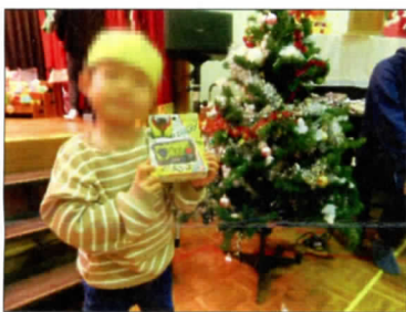
ビンゴでこれもちやいました

そして聖なる夜には多目的ホールでクリスマス会が行われました。豪華なクリスマスツリーには、児童らが作ったサンタクロースの折り紙やリースが飾られました。ホールに入ると「うわあすごい」「かわいー」などの児童の声がたくさん聞かれました。指導員の楽しいオーブニングでクリスマス会の幕が上がりました。