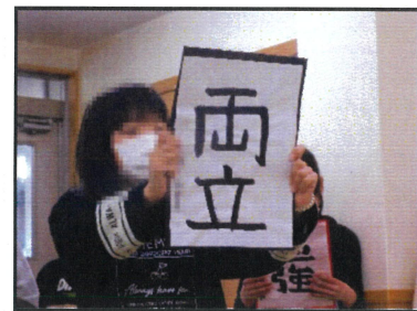
入学後の目標を書にしたため発表しました。

こども園児は鞆やハンカチ、小学生は筆箱、中学生は新しい文房具、高校生は通学で使用する鞆が贈られました。新しい品々に目をキラキラさせ、「この文房具で頑張ろう」と意気込む児童の姿が見られました。次に入学・入園後の目標を皆の前で披露しました。こども園児と小学生はそれぞれ頑張りたいことを絵に描き、「こども園で滑り台をしたい」「小学校で勉強を頑張りたい」等大きな声で発表しました。中学生は習字で「部活」や「勉強」等力強い文字と共に発