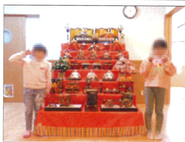
雛飾りの横でピースサイン

また、別日の夕食でちらし寿司が出ました。お内裏様とお雛様の絵の入った可愛い寿司で、食べるのがもったいないぐらいでした。