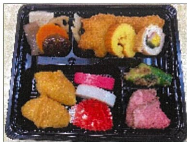
色とりどりのお節料理