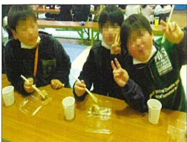
どれも美味しくて食べ過ぎた

遊戯コーナーのダーツは20人以上の行列ができるほど大人気でした。狙いを定めて目を細め集中して投げ、当たった時は飛び跳ねて喜んでいました。児童は、袋いっぱい景品を持