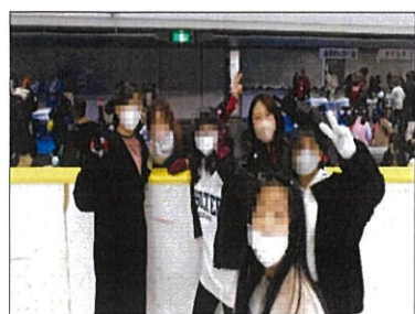
やっぱ未来っ子はスケートでしょ

未来っ子カーニバル 12月18日に、2年振りに未来っ子カーニバルが開催されました。「久しぶりにスケートができる」「今年はどうなアイスがあるのかな?」とワクワク、ドキドキで会場へ向かいました。児童はスケートや、思い思いのブースへ行き、ヘアアレンジやネイルサロン、パルーンの遊具やじゃんけん大会などを楽しみました。また、綺麗な衣装のスケートショーに感動し、思わず「きれい!」とため息をもらしました。初めてスケートに挑