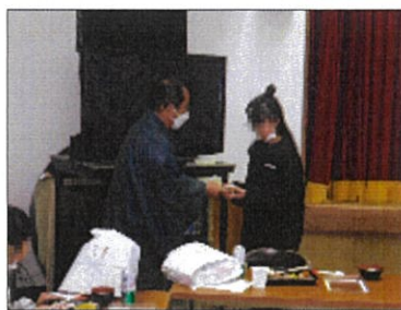
お年玉をもらって この後はみんなで初詣へ

お年玉は、園長がそれぞれの食事会場を回って、一人ひとりに声を掛けながら手渡しました。ポチ袋の中を覗いて、笑顔を見せる児童の頭の中には使い道が決まっているようでした。