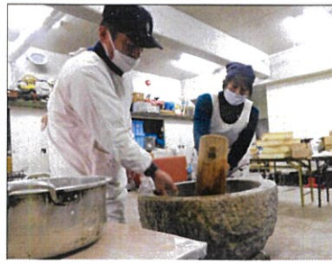
息を合わせて ぺったん、ぺったん、ぺったんこ

12月29日に、餅つきをしました。つきたてのお餅に甘いきな粉をまぶし、安倍川もちにして児童に振舞われました。幼児部屋に運ばれてきたお餅を見た幼児は目を輝かせ大喜びでした。まだ温かく柔らかいお餅を食べ「美味しい」と味わいながら食べていました。