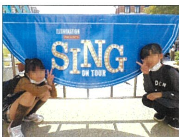
新しいアトラクションに ワクワクドキドキ

を使わせてもらいました。「何食べる?」と聞くと「パンケーキ」「ハンバーガー」と即決。出てきた食事をべろりと完食し、午後からもいっぱい遊びました。ジュラシックパークで恐竜を見て「あれ本物?」と後ずさっていた児童も徐々に慣れて「おっ!」と笑顔で手を振っていました。年少児を気にかけて、手を繋いであげる年長児の姿が見られるなど和気あいあいとパーク内を散策し楽しい時間を過ごしました。