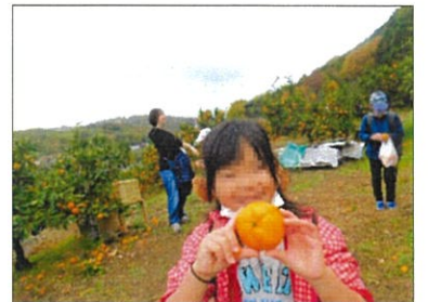
「大きいみかんが採れたよ」