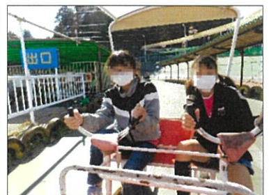
変わり種自転車を楽しみながら ミッションクリア！

10月30日に、関西サイクルスポ ーツセンターで開催された目で見る 自然教室に6年生の4名が参加し ました。