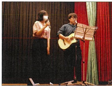
デビューしちゃう？

ら、普段優しく温かく見守って られている園長のいつもの姿 に児童だけでなく、職員も笑いが 止まりませんでした。 可愛くてかっこいいダンスにお 笑いにと、歓声と笑いに包まれた 楽しいひと時となりました。