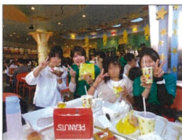
好きな食べ物で お腹がいっぱいになりました

ロータリークラブUSJ招待 10月23日に、大阪柏原ロータリークラブ様より武田塾と合同でユニバーサル・スタジオ・ジャパンに招待して頂きました。バスに乗り到着すると見えてくる絶叫系アト