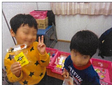
「これ欲しかったやつ!」

幼児は午前中に行い、アンパンマンや戦隊ものの玩具を手に入れました。当て物コーナーで早速当たりの景品を多数引き当てて、商品を手に入れました。