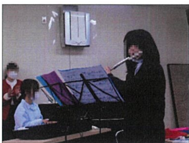
フルートの音色にうっとり

12月17日に、国分東コミュニティ会館にて行われるファミリーコンサートに、小学校1年生から4年生までの17名の児童が参加しました。最前列から2列に座り、南京玉すだれ、ベル演奏、マジック、旗上げの出し物に目を輝かせて楽しんでいました。また、演奏者の中に本園の中学生がおり、一生懸命に吹く姿に感動しました。参加型の出し物には「やりたい」と積極的に参加する児童が多く、笑顔がたくさん見られました。最後に輪投げに挑戦し、児童にとっても忘れられない時間となりました。