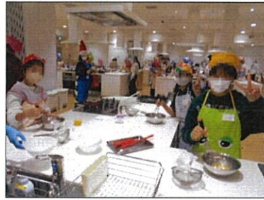
お菓子作りのコツは正しい計量です

まーやに帰宅すると留守番をしていた他児や職員へ渡ししていました。とても心温まる優しい姿を見せてくれました。少しずつではありますが、人を思いやる気持ちも芽生え心も成長してくれています。「今日は行ってよかった。またお菓子作りしたい」と楽しい日となりました。