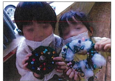
「見て、見て、これ作ってん」

「丸の形に切るの難しい」とハサミでリースの丸やブーツの形を切る工程に苦戦していました。毛糸を巻き付ける時に隙間なく巻く児童もいれば、大きく間を開けて巻く児童もあり、個性豊かな作品ができました。最後にカラフルなビーズやスパンコールを貼りつけました。廊下や部屋に飾ると館内がクリスマスムードになりました。