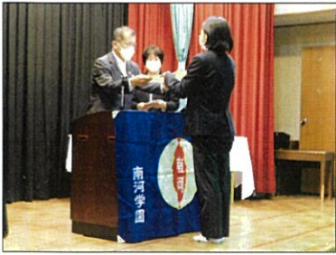
よく頑張りました

い所が激励文として伝えられま した。園長から激励をもらい、 また明日から出発です。全員が、 嬉しそうに笑顔で終える式典と なりました。