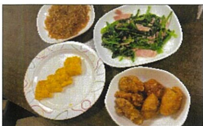
おいしい料理のできあがり♪

また、別日に行った地域小規模共生ホームの男子児 童は「卵焼きは甘い派」とのことので甘い卵焼きに挑戦 し、段取り良く進め4品を45分程で仕上げました。