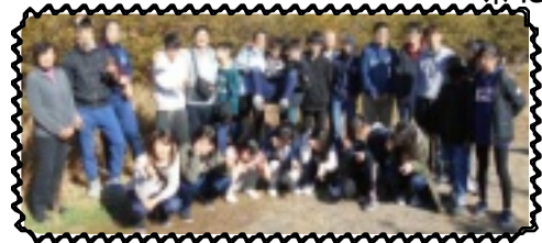
いつも美味しいお肉ありがとうございます

色やん」と楽しんでいました。美味しいお肉をお腹いっぱい食べ、帰り道では「来年も美味しいお肉食べれるかな?」ともうすでに今から楽しみにしている子もいました。