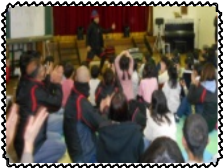
こんな手品見た事ない

9月26日にゴールドマンサックス証券株式会社様より招待頂き、京セラドーム大阪での『日本ハム対オリックス』を観戦に行きました。野球に詳