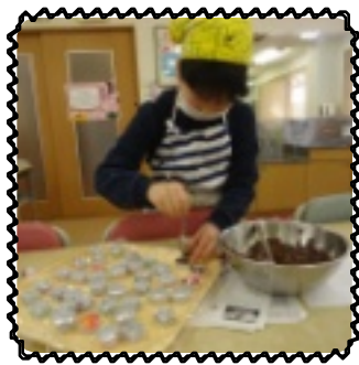
愛のこもった手作り

「何にしよう」と本やパソコンで調べ、クッキーやカップチョコ、マシユマロチョコに決め、それぞれで買い物に出かけます。材料、ラッピングやトッピングを購入し、作る前から「可愛いな」と見せ合います。作り始めると「思ったようにできひん」とと、咳く児童や黙々と進める児童など様々でした。出来上がる頃にはいい匂いが漂いました。ラッピングを終えると洗い物に掃除と最後までしっかりと済ませます。出来上がったお菓子を、児童らは担当の職員や友達などそれぞれに渡していました。