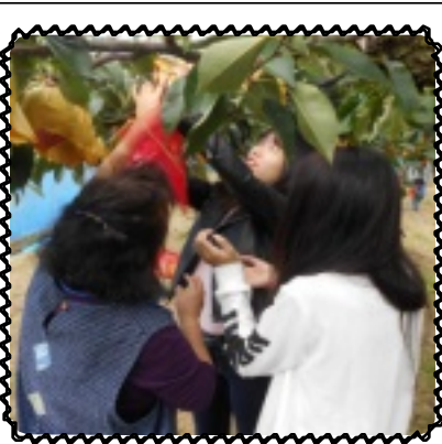
美味しい梨はどれ〜だ

「選んで！」と選んでもらう児童や、他児と「どれが美味しいやろう？」、「美味しさより大きさをやな」とそれぞれ真剣に選んでいました。大きな梨を2個ずつ取り、おいしいお弁当を食べた後に自分で選んだ梨を剥いて食べました。梨の皮を剥くのに苦戦しながら「美味しい」「瑞々しいなあ」と笑顔で食べていました。