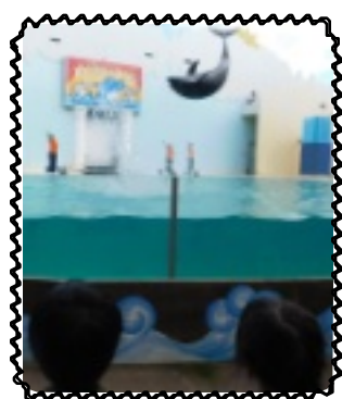
可愛いイルカショー

からも笑顔で水がかからないようにフードを被ったり、レジャーシートに隠れたりしていました。イルカショーが終わり、ピシヨピシヨになっている児童もいましたが笑顔で「楽しかった」「イルカかわいかった」と話していました。