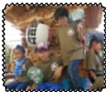
だんじりに乗ったよ

10月13日、14日に昭和町秋祭りに小学生全員と中高生数名が参加しました。天気も両日晴れに恵まれました。初めて参加する児童、毎年参加する児童と様々でしたが、みんな大きな声で「やっさいこーりゃー」と綱を引っ張りました。休憩時間には興味津々の児童が「先生、だんじりっておっきいなあ」と、地車に乗り、喜んでいました。力いっぱい引っ張る児童、青年団の歌や掛け声を真似する児童と、思い思いに楽しい時間を過ごしました。