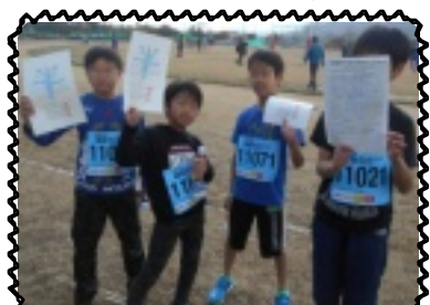
最後まで完走したよ!

スタートして、職員の応援にも熱が入ります。皆一生懸命に走って、中には手を振ったり、カメラにピースを決める余裕のある児童もいました。ゴールして、それぞれ完走証を手に「去年より順位落ちたわ」「初めてやけど楽しかった。来年もやる。来年はもっと早く走る！」とたくさん感想が飛び交いました。