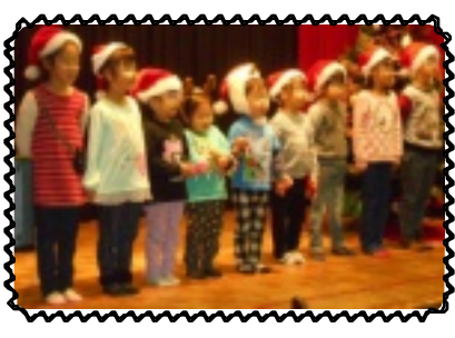
可愛い幼児さんの唄

その後、舞台裏から職員扮するサンタクロースとトナカイが登場し、お菓子の袋詰めが配られました。「〇〇先生や〜ん」と正体はバレバレでした。各班長が前に並び、ソロプチミストさんから頂いたシャンメリーで乾杯をしました。幼児から歌の出し物があり、少し緊張気味の子もいましたが、鈴を鳴らして可愛く歌ってくれました。その後指導員によるゲーム大会も行われ、児童は大盛り上がり。とても楽しいクリスマス夜を過ごしました。