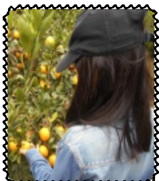
甘いみかんはどれだ！

高学年グループは、富田林市にある城山オレンヂ園へみかん狩りに行きました。最寄り駅の汐ノ宮駅から40分程かけて山を登ります。「山登りって楽しい！」「あ！カマキリおった！」と楽しんでいました。