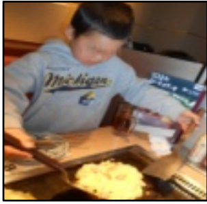
うまひっくり返せるかな

また、店員さんがマヨネーズを高い位置から「ユーツ」とかけて、「すごー!」「めっちゃきれい!」と喜んでいました。さらにネギ焼きと焼きそば、デザートは「シャーベット」まで頂き、児童らは「こんなにたくさん!」「うまい!」大満足でした。