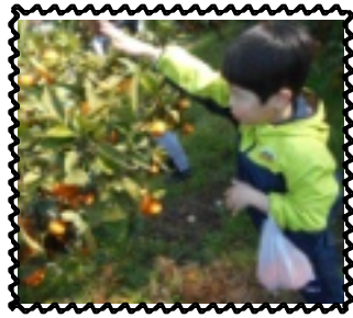
甘いみかん捜索中

と最後はみんなが集まって日向ぼっこです。みかん狩り後は、若草公園に戻りシートを敷いて、お弁当を頂きました。みかんにお弁当にたくさん食べ満足で帰りました。