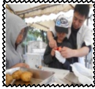
協力して作ったよ

からのカレー作りで、みんな黙々と作業に取り組みます。野菜を丁寧に切ったり、火おこしを手伝ったり、お米を研いだりと、普段中々出来ない作業に児童らは集中して取り組んでいました。出来上がったカレーはそれぞれのグループで味が違い、「うちのところが一番美味