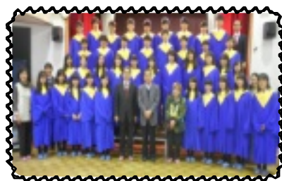
心地よい歌声でした

歌の合間には、じゃんけん列車をして広島三育学院聖歌隊の皆さんと交流をはかりました。最後にはみんなと一緒にジングルベルを歌いました。素晴らしい歌声を聞いた児童達は「こんな上手な歌が聴けて良かった」「また来年も来てほしい」と口々に話をしていました。また機会があれば是非ともよろしくお願ひします。