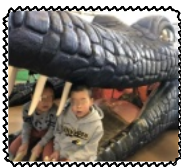
ワニに食べられた!?

小学生男子低学年の兄弟は、泉ヶ丘にあるビッグバンに行きました。まず、お昼ご飯は職員と事前にとんなお店があるのかりサーチし、焼き肉店に決めました。肉も野菜もモリモリと食べ満腹です。それから、待ちにまつたビッグバンへ。大きなワニの遊具や4階から8階にもわたる大きなジャングルジムを見て、「きゃ〜！」と大きな声で大興奮の2人。冬の寒さにも関係なく、半そでになり汗だくになって遊んでいました。