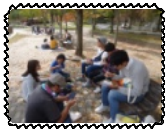
みんなでお弁当食べたよ

スポーツ組はバレーやサッカー等、球技を楽しんでいました。ボールを2個使ってサッカーをする等、それぞれ好きなように楽しんでいました。ひつつき虫が沢山発生しており、気付いた時には身体中ひつつき虫だらけ！「何やねんこれ！」とお互いについたひつつき虫をつけ合っていました。