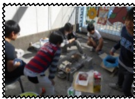
みんなでバーベキュー

大きい児童は、指導員の火の当番を代わってくれたり、焼く係になってくれたりと、お手伝いをしてくれました。お肉や、キャベツ、ジャガイモ、ウインナー、エビなどたくさん焼き、「あつい、あつい！」「もっと食べたい、早く焼けへんかな」とモリモリ食べました。メは焼きそばを作って食べました。デザートには、退園生から頂いた新高梨を皆食べました。「俺、剥きたい！」と包丁を手にし、児童が皮を剥いてくれました。「美味しいこの梨！」「甘い！」「もっと食べたいわ。この梨サイコー」と大喜びでした。