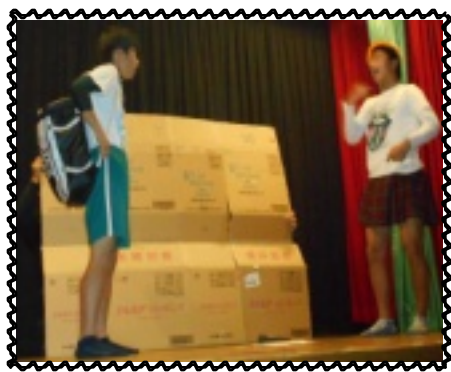
プロ顔負けコントで大爆笑!

そして夜は、当施設伝統の行事『演芸会』を行いました。長年続けてきた行事ということもあり、この日には退園生や元職員だった方も、児童の成長した様子を観に来てくれます。久しぶりの再会に児童たちは照れながらも、次から次へ話を聞いてほしいと寄っていき、再会を喜ぶ姿も見られました。開始の時間になり、児童会会長の挨拶で演芸会が始まりました。舞台の幕が開き、トップバッター