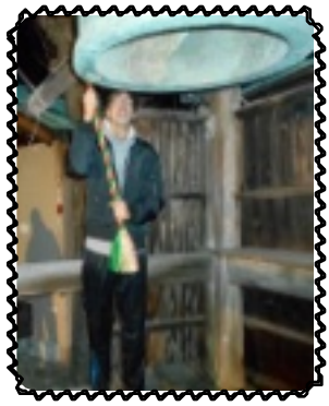
ゴーンと鳴らした

カウントダウンが始まり「10・9・8...3・2・1・ゼロ〜!」と皆で年を越しました。「明けましておめでとうございます」「今年もよろしく願います」とお互い挨拶を交わしていました。ゼロの瞬間ジャンプをしている児童もいました。お餅と年越しそばを頂きながら、平成最後の大晦日終えました。