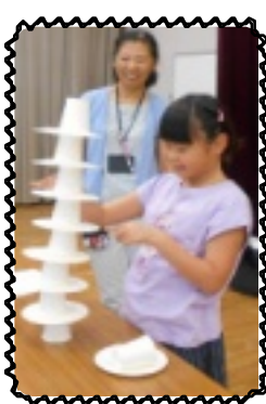
こんなに高く上げました

帰ってきてからお土産のぶどうを、児童、職員皆で沢山食べました。「おいしい!」「おっきい!」など笑顔で食べていました。