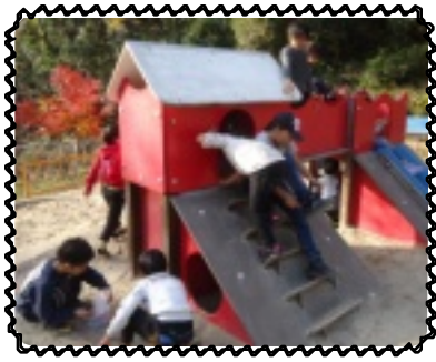
汗びっしょり遊んだ！

玉手山公園に着き遊具や芝滑りを見て「早く遊びたい！」と荷物置いてすぐに遊具へ走ります。芝滑りでは「せーの」とみんなと一緒に滑っていました。遊具ではローラー滑り台で寝転んで滑ったり、二人で一緒に滑ったりと色々な滑り方をして楽しんでいました。15時になり持参したおやつを食べ、もう少し遊び、学園に帰りませう。帰り道、紅葉が綺麗で「秋見つけ！」と落ち葉を拾い持ち帰る児童もいました。また、近場の大きな公園に遊びに行きたいと思います。