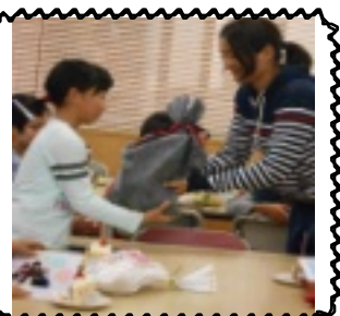
プレゼントもらったよ

南河学園では8の数字は末広がりで縁起が良いということで、毎月8日の夕食時にお誕生日会を開いています。職員や児童からお祝いの言葉を貰い、最後に皆で『おめでとこの歌』を歌い、ロウソクの火を消す。園長や職員からそれぞれお祝いの言葉を貰い、最後に皆で『おめでとこの歌』を歌い、ロウソクの火を消す。