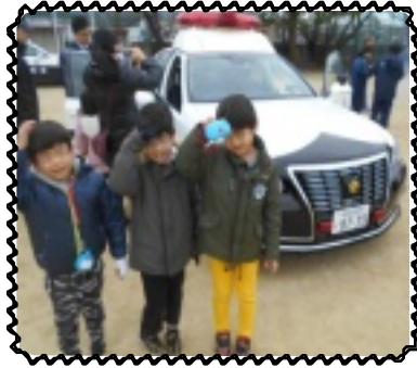
可愛いおまわりさん

地域文化交流では、健全育成会、PTAの皆さんのコーラスや柏原東高校ダンス部のダンス、国分東小学校のリコーダー、国分小学校の太鼓演奏、国分中学校吹奏楽部の演奏があり児童は知っている音楽に手拍子などで参加しました。今年も本園のしめ縄を燃やして頂き、児童や職員が良い一年間を過ごせるようにお祈りしました。