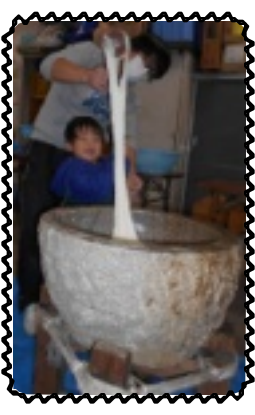
びよーんとのびた

12月29日は本園の地下駐車場にて恒例のもちつきを行いました。園長や指導員が餅をべったんべつたんつき、副園長や保育士が小さく丸めます。児童も幼児から順番に小さい杵で、べったんべつたんつきます。「よいしょ〜よいしょ〜!」と掛け声がかかると、児童からもつられて「よいしょ〜!」と大きな声をあげます。高校生男子は、指導員に負けないほどパワフルで、元気よくついてくれました。皆でついた餅は、きなこ味としょうゆ味で食べます。「おいし〜」「もちもちや〜」と喜んで食べていました。