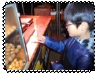
めっちゃくちゃ美味しい!

12月23日の夜にB級グルメの会の皆さんが慰問に来てくださり保育園のグラウンドで屋台を開いてくださいました。今回のメニューは、ロングポテト、肉吸い、唐揚げ、富士宮焼きそば、ベビーカーテラ、牛串とたくさんふるまって頂きました。児童は「どれから食べようかなあ」と色々と考えながら、それぞれが思い思いに好きな物を順番に食べていました。幼児の中では特に唐揚げが大人気で、食べる事に夢中になり黙々と食べていました。学童児童は同じメニューを何度も食べる児童や1種類ずつ味わって食べる児童がいました。「肉吸い温まる〜」「牛串うますぎる」「唐揚げ二個目」と皆心もお腹も大満足でした。寒い中準備から片付けまでありがとうございました。