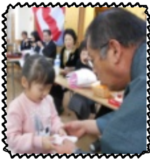
お年玉もらったよ

2019年、最初の行事です。幼児から学童、共生、まーや、職員、南河学園にいる全員が食堂に集まって1年の最初の挨拶をします。理事長、園長から新年のお言葉を頂き、みんなでおせち料理を食べます。お重の中身はまるで宝箱のように、キラキラとしたおせち料理でいっぱいです。お待ちかねの園長からお年玉も頂き、児童らは大喜び。中身を確認したくてウズウズしていました。